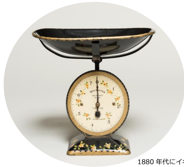
1880年にイギリスで使われていたキッチンスケール 東洋計量史資料館収蔵